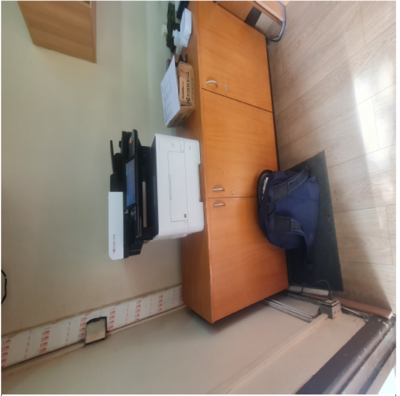
Fotografía del panel de la máquina